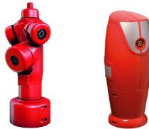
Poteau incendie à plusieurs accès