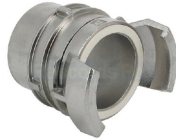
Raccord Guillemain aussi appelé « pompiers »