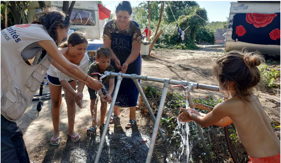
Rampe d'accès à l'eau sur un site à Toulouse, 2023

moyenne, cf. question 18). Si ces solutions sont inexistantes ou techniquement infaisables, le raccordement sur bornes ou poteaux incendie avec l'accord de l'autorité responsable de la gestion de défense extérieure contre incendie est possible. (cf. question 15).