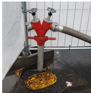
Trappe de borne incendie - Cette typologie peut nécessiter la mise en place d'un dispositif en Y ou T pour laisser un raccordement de protection incendie libre