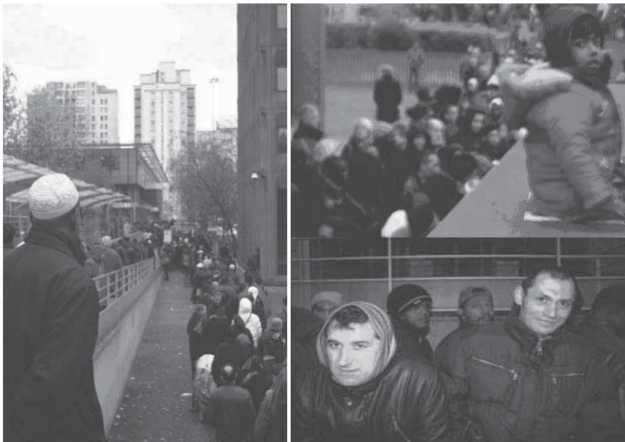
Silhouettes et visages dans les queues au lever du jour - novembre 2009 (Photos - article 11)