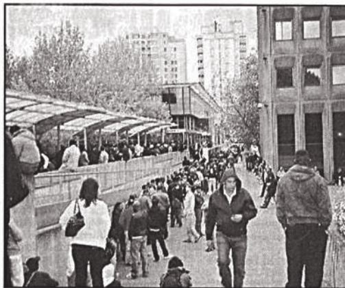
... Et, au petit matin, le réveil est difficile !

8 heures, trois policiers baraqués scrutent la foule. « Vous allez voir, ils nous parlent comme à des chiens ! » 8 h 30, ça va ouvrir, tout le monde s'agite. Un flic alpague la deuxième de file : « Madame, vous étiez pas là quand je suis passé tout à l'heure, vous sortez de la queue ! - Je travaille de nuit, mon mari a attendu pour moi ! - Donc vous y étiez pas ! Monsieur et madame étaient là, eux je les ai vus ! Dernier avertissement ou j'appelle les ren-