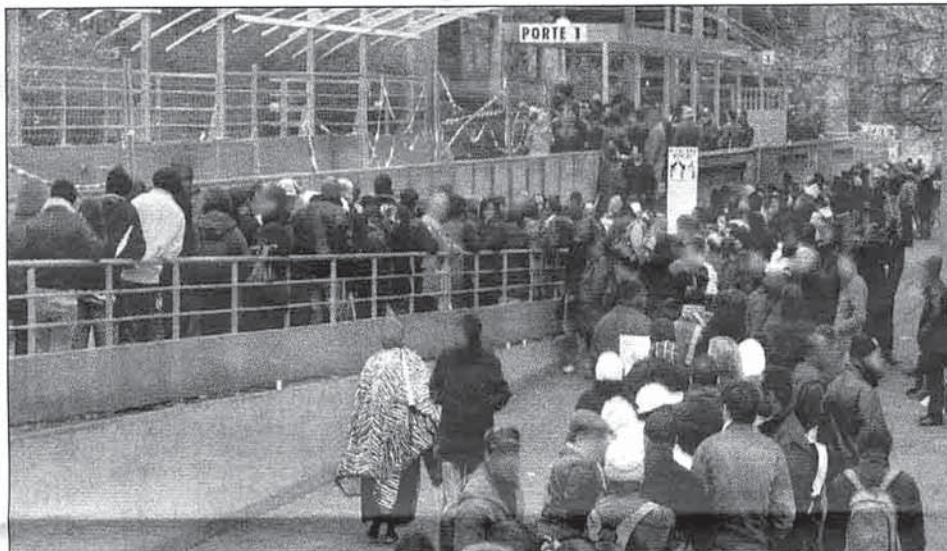
PREFECTURE, DIRECTION DES ETRANGERS, JEUDI MATIN. Certains passent la nuit sur place pour être sûrs d'être reçus. Beaucoup arrivent dès 5 heures du matin, seuls ou avec des enfants.

Des conditions d'accueil jugées « indignes » par le Réseau éducation sans frontières (RESF) qui rend public ce matin, de 7 heures à 9 heures sur le parvis de la préfecture, le résultat de ses observations et de ses comptages menés la semaine dernière dans la file. Jeudi, ce sont ainsi 100 personnes qui auront attendu... pour rien. Le constat est sévère : « Aucune information claire et multilingue n'existe sur les modalités à suivre, les documents à fournir, la file