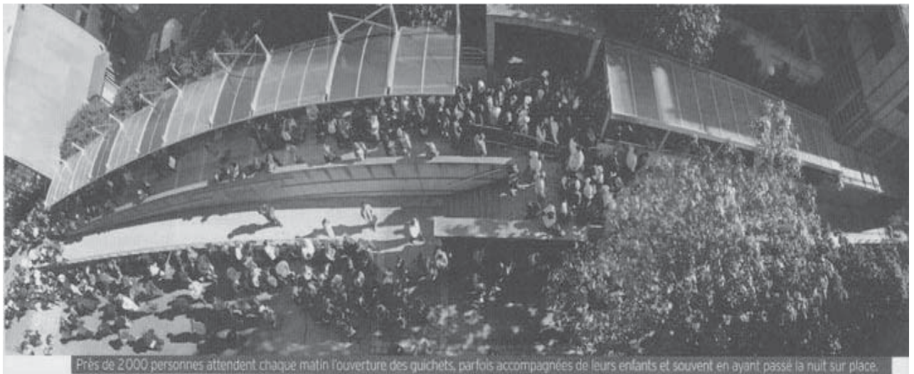
Près de 2000 personnes attendent chaque matin l'ouverture des quichets, parfois accompagnées de leurs enfants et souvent en ayant passé la nuit sur place.

Oui, décidément un constat lucide et qui appelle, comme nous le faisons, à un changement radical de politique dans ce département.