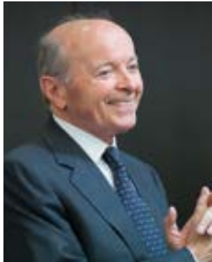
Jacques TOUBON, Défenseur des droits

Écoutons la parole des enfants et respectons les promesses qui leur ont été faites il y a déjà près de 30 ans !