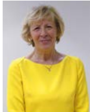
Geneviève AVENARD, Défenseure des enfants Adjointe du Défenseur des droits