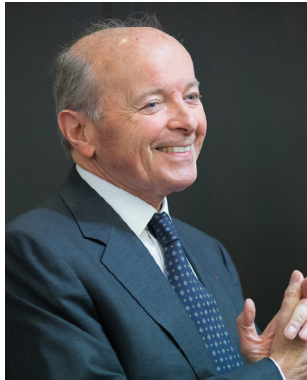
Jacques TOUBON, Défenseur des droits

Écoutons la parole des enfants et respectons les promesses qui leur ont été faites il y a déjà près de 30 ans !